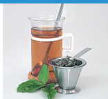
Tee ohne Zucker